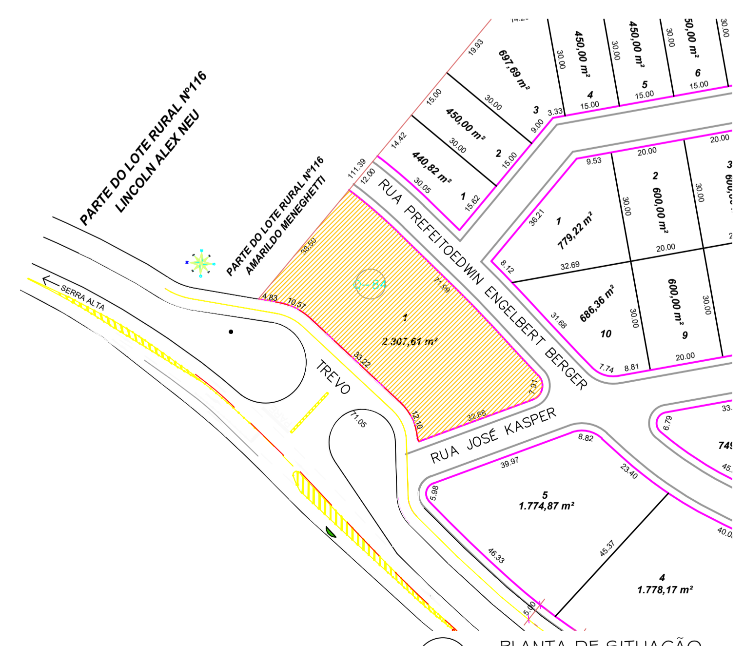
3 PLANTA DE SITUAÇÃO Escala: 1/1000